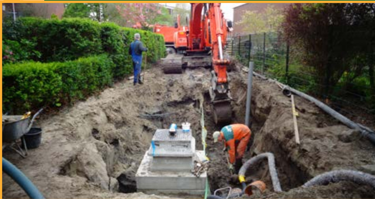
Riolering de Opstal, Naaldwijk

Met een omzet van ca. € 22 miljoen en 110 vaste medewerkers zijn we inmiddels een bedrijf van formaat. Een bedrijf dat u door heel Nederland kunt tegenkomen. We mogen bekende namen tot onze opdrachtgevers rekenen. Provincies, gemeenten, projectontwikkelaars, noem maar op. Opdrachtgevers bij wie we de naam hebben een bedrijf te zijn dat staat voor kwaliteit, dat alternatieve oplossingen aandraagt, dat doet wat afgesproken is.