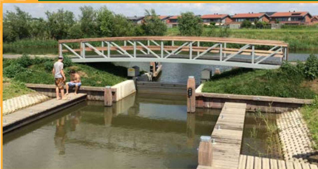
Aanleg Recreatiesluis Koedood, Albrandswaard (D&C)