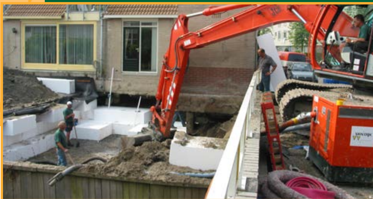
Wijkreconstructie De Velden, Schiedam (Bouwteam)